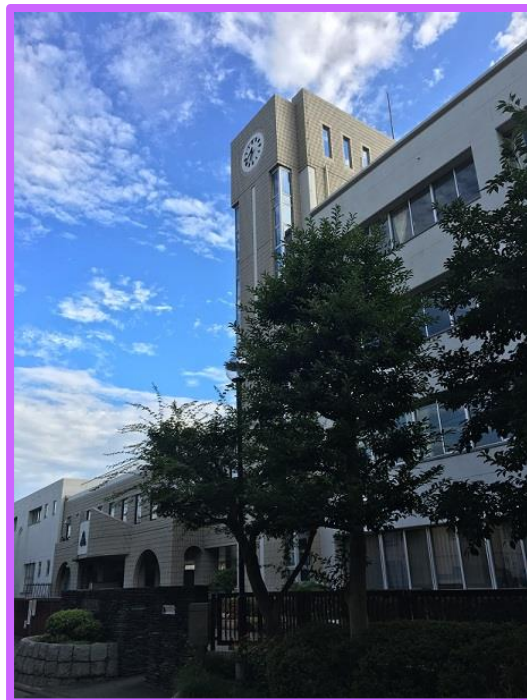
大きな時計塔が目印になります。