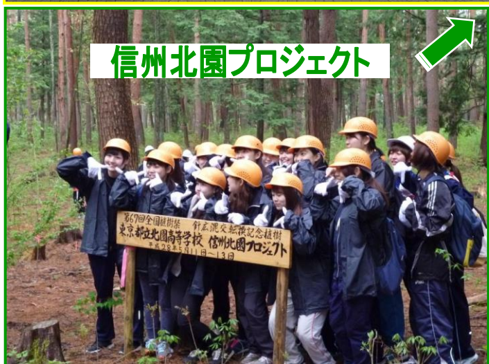
信州北園プロジェクト