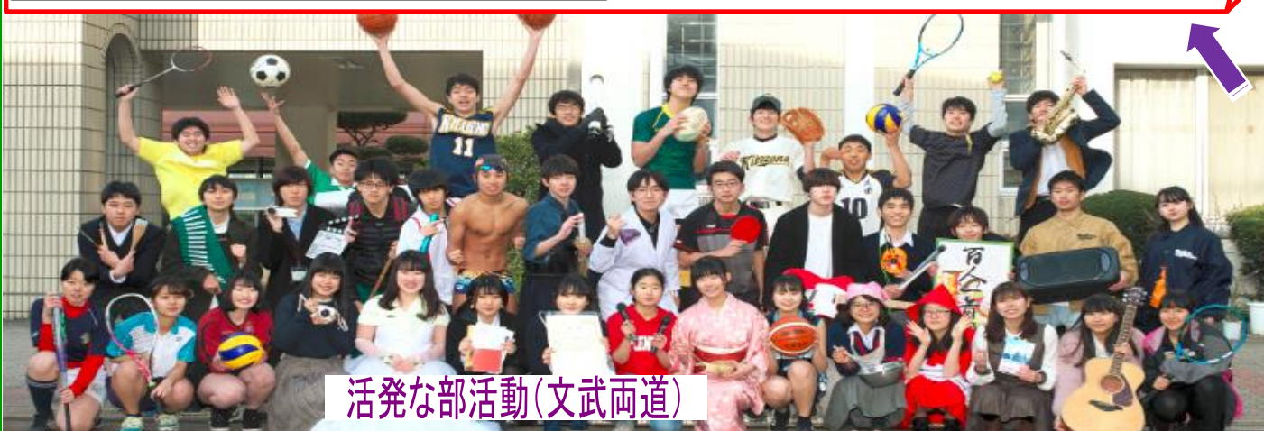
活発な部活動(文武両道)