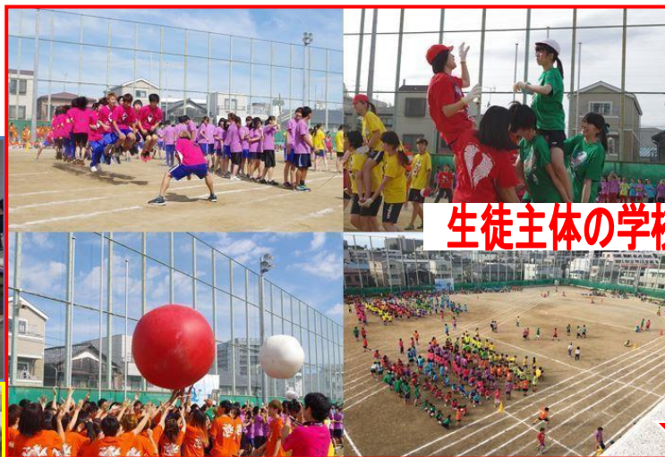
生徒主体の学校行事