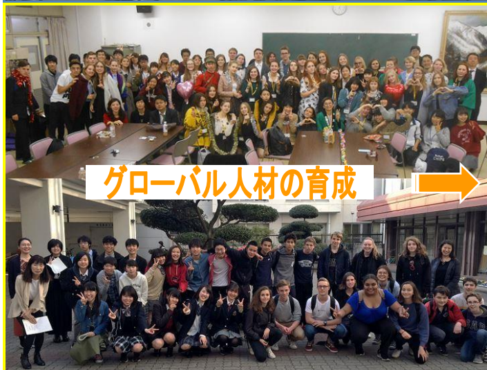
グローバル人材の育成